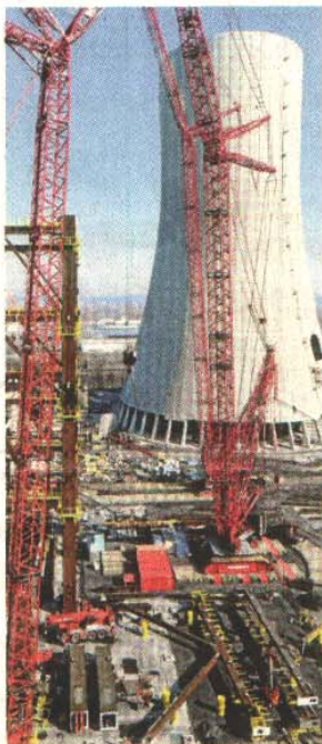
Trianel in Lünen.

Es ist eine Frage, die Juristen schon seit Jahren streiten lässt. So auch gestern wieder. Bundesregierung und Trianel verteidigten das deutsche Recht, wonach Umweltverbände im Rahmen von Genehmigungsverfahren Verletzungen von Vorschriften zum Schutz von Natur und Umwelt nicht einklagen können, weil damit keine individuellen Rechte Einzelner berührt seien. „Nur wer in seinen eigenen Rechten verletzt wird, hat das Recht, dies gerichtlich prüfen zu lassen. Umweltverbände vertreten nicht notwendigerweise die Interessen der Allgemeinheit“, erklärte Trianel-Anwalt Christoph Riese.